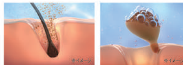
吸着・浮上をくり返し、細かい汚れを取りのぞく

ウルトラファインバブルが毛穴の奥まで入り込んで汚れを取りのぞき、マイクロバブルが毛穴につまった大きな汚れを浮かせて取りのぞきます。